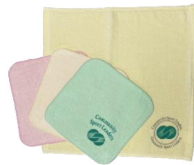
ハンドタオル (イエロー) 610円