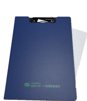
クリップファイル 1,000円