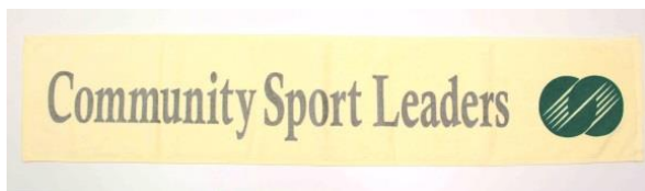
マフラータオル (イエロー) 1,020円