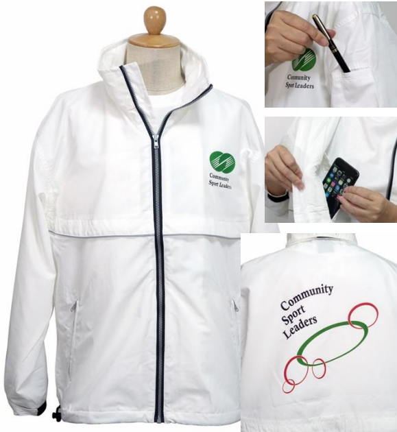
ジャンパー (ホワイト・男女兼用) 7,200円