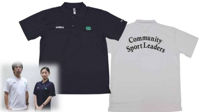
ポロシャツ (男女兼用) 3,500円